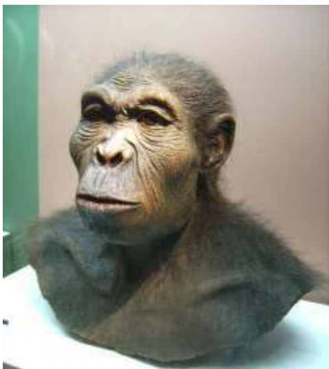
Реконструкция Homo habilis