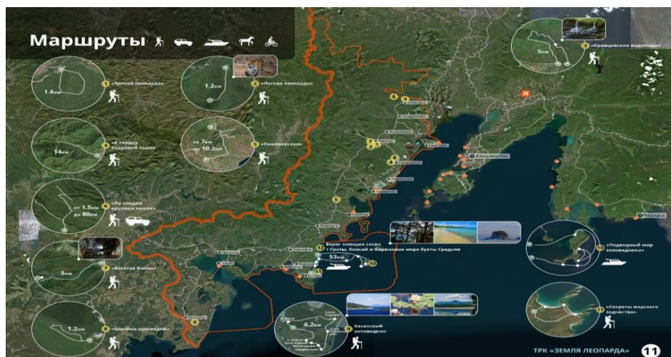
Рис. 1. Графическое представление туристической ориентации кластера Fig. 1. Graphical representation of the tourist orientation of the cluster