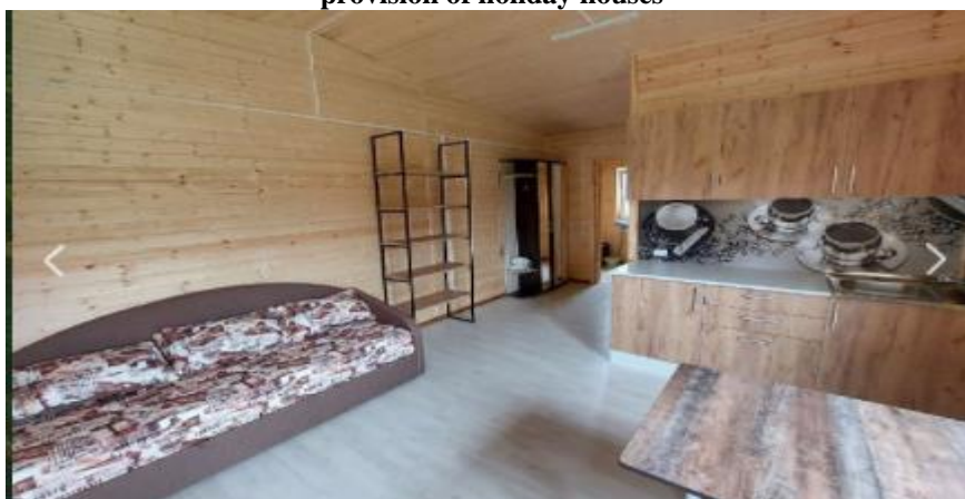
Рис. 5. Пример внешнего вида домика для отдыха «Пантовый» Fig. 5. An example of the appearance of the holiday house «Pantovyy»

Наибольшей востребованностью пользуется услуга пантового дома, так как подобного уникального продукта нет в Приморском крае. Тип данного домика востребован как для семейного, так и для персонального отдыха. Пример интерьера домика для отдыха представим на рисунке 5.