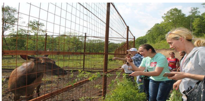
Рис. 3. Пример посещения мараловой фермы Fig. 3. An example of a visit to a deer farm

Примером посещения мараловой фермы служит рисунок 3.