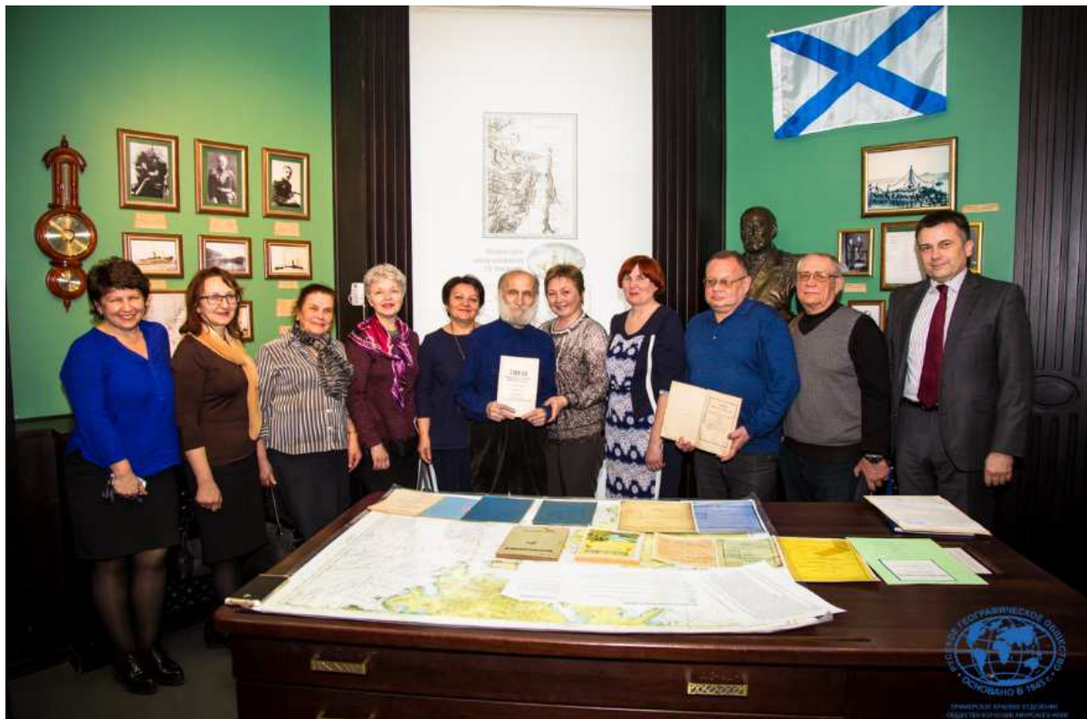
Рис. 5. Встреча исторического клуба в зале Кабинет исследователя Приморского государственного объединенного музея им. В.К. Арсеньева, посвященная 130-летию юбилею «Записок Общества изучения Амурского края», 11.04.2018 г.

С высоты сегодняшнего профессионального опыта оцениваю, что многое можно было сделать лучше. Но вспоминаю, что в те «лихие девяностые» мы старались изо всех сил выполнить поставленную нам задачу и соответствовать высоким и бескорыстным идеалам основателей Общества изучения Амурского края (рис. 5).