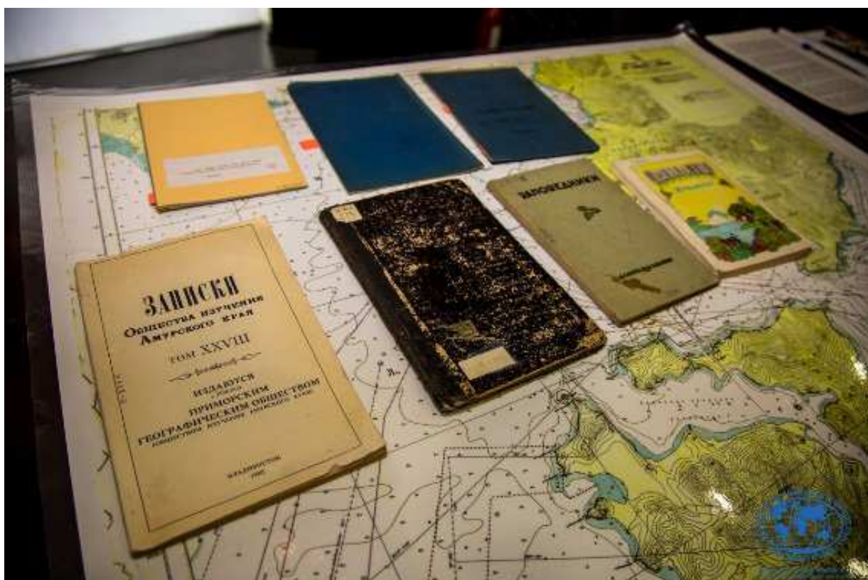
Рис. 1. Записки ОИАК разных лет