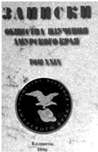
Рис. 3. Юбилейный выпуск журнала к 110-летию ОИАК