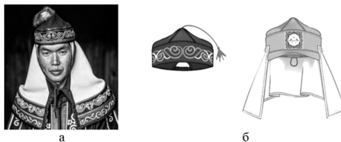
Рис.2. Творческий источник для создания сувенирного функционального головного убора: а) традиционный головной убор удэгейцев; б) разработанный головной убор

За счет последовательной или совместной трансформации ряда съемных элементов: жесткого козырька, ушек, отлетной детали в виде пелерины базовая основа сувенирного головного убора может модифицироваться в следующие головные уборы: шапочка с ушками (рис. 3,б), кепи с жестким козырьком (рис. 3,в), кепи с ушками и жестким козырьком (рис. 3,г), шапочка с отлетной деталью для защиты боковой поверхности головы, шеи и верхней части плечевого пояса (рис. 3,д), кепи с жестким козырьком и отлетной деталью (рис. 3,е), кепи с жестким козырьком и отлетной деталью с передним фигурным срезом с завязками (рис. 3,ж).