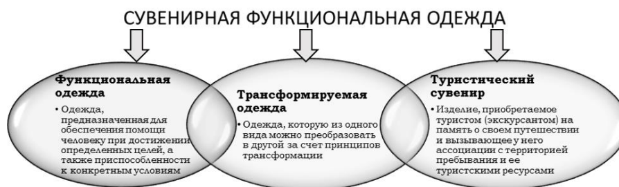
Рис. 1. Формирование понятия «функциональная сувенирная одежда»

Исходя из этих определений, синтезируя их в единое целое, можно определить требования к функциональной сувенирной одежде: уникальность, функциональность, компактность хранения и транспортировки, связь с территорией, адаптация к изменяющимся климатическим условиям, соответствие современным трендам.