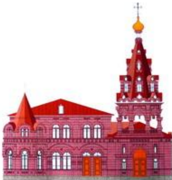
Рис. 2. Проекты строящихся Спасо-Преображенского собора и Марфо-Мариинской женской обители

И пусть храмы региона не имеют за собой многовековой истории, как многие храмы европейской части России. В мире немало и современных памятников, которые привлекают туристов. Для туристов из сопредельных государств это не всегда и так важно.