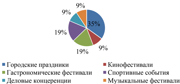
Рис. 1. События Приморского края в 2019 году, в процентах

Нельзя не признать, что в целом гастрономический туризм как вид событийного туризма приобретает широкую популярность в России. Что касается развития событийного и гастрономического туризма на Дальнем Востоке России и Приморском крае в частности, то в настоящий момент событийный туризм в Приморском крае представлен гастрономическими, спортивными, музыкальными фестивалями, деловыми конференциями, и городскими праздниками (рис. 1).