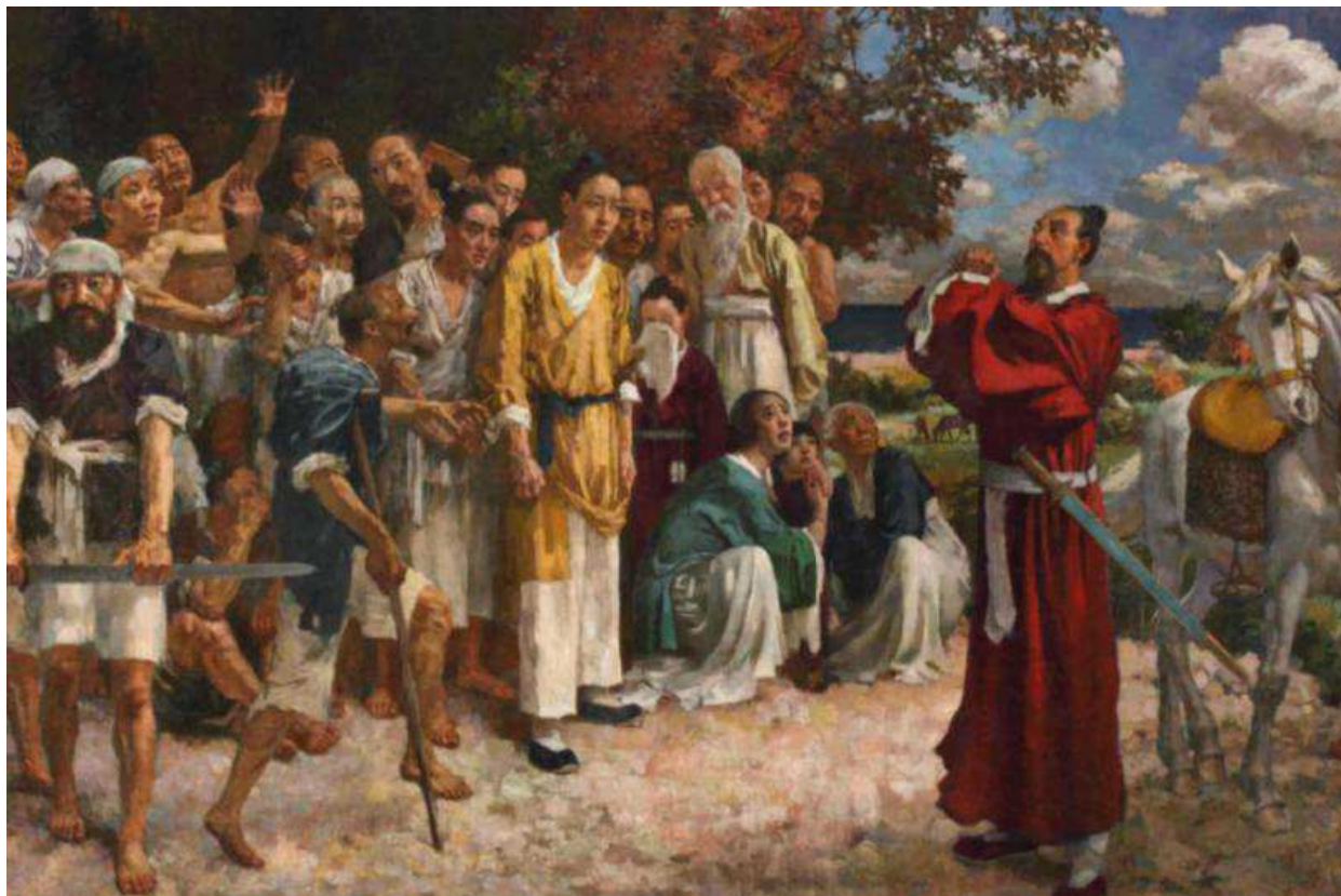
Рис. 5. Картина художника Сюй Бэйхун «Пятьсот воинов Тянь Хэна»

Реформа Сюй Бэйхун «внедрение академического рисунка в традиционную живопись» привнесла реалистичную энергию в классическую китайскую живопись (в основном работа тушью). Как отмечал Цзинь Шань, даже в ранней работе Сюй Бэйхун «Пятьсот воинов Тянь Хэна» (рис. 5), хотя и прослеживаются характерные черты советской живописной школы, однако наблюдается влияние европейского искусства, но при этом сохраняется традиционная эстетика так называемой «литературной живописи» в стиле Жэнь Бонянь (много работавшего в жанре «цветы и птицы»).