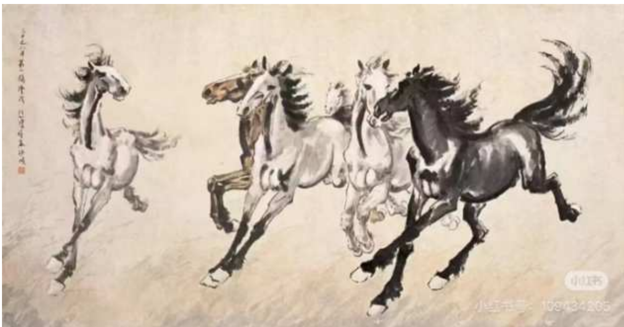
Рис. 3. Картина художника Сюй Бэйхуна «Скачущие лошади»

В другой картине художника Сюй Бэйхуна «Юйгун, передвигающий горы» можно наблюдать, что, хотя он заимствует масштабный нарративный стиль советской школы, интегрируя традиционные техники линейного рисунка, который получали все обучающиеся в российской академии китайские студенты, он также использует мощные и энергичные линии для передачи «правдоподобия» жизни персонажей, сохраняя характерную для акварели эстетику. Такой подход «адаптации западного искусства через китайское» использовал Сюй Бэйхун в своем творчестве.