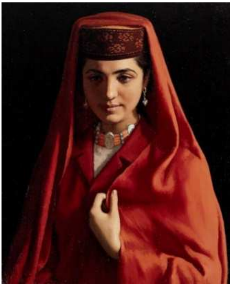
Рис. 6. Картина художника Цзинь Шань «Невеста из Таджикистана»

Современное художественное образование в условиях волны глобализации проходит испытание межкультурной интеграцией. Российская Академия художеств имени И. Репина, продолжает расширять свое влияние в Китае.