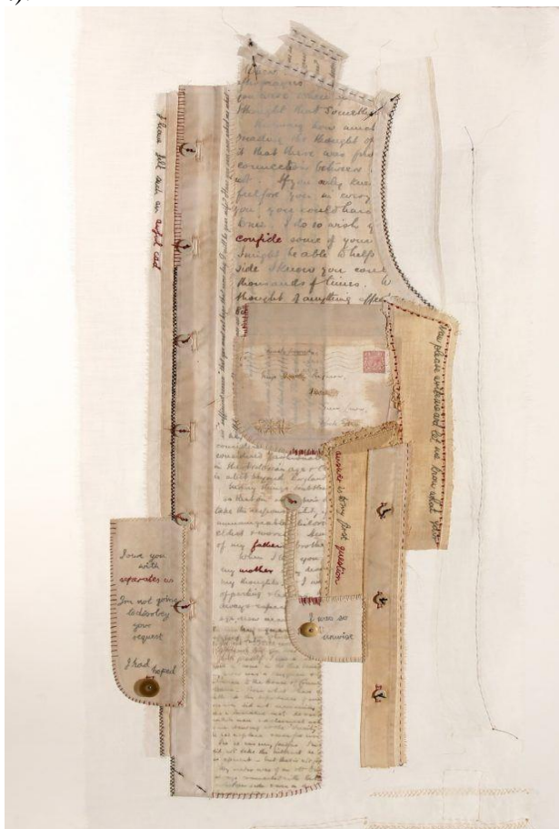
Рис.1- Али Фергусон «Вышивка эмоциональных связей»

Концепт палимпсеста в дизайне костюма — это отражение идеи многослойности и перезаписи, где каждый слой символизирует разные эпохи, стили или личные истории [4]. Представьте костюм, который выглядит как будто состоит из нескольких старых слоёв: ретро-элементов, современных деталей и элементов будущего, — всё одновременно существующее на одном полотне (Рис.1.).