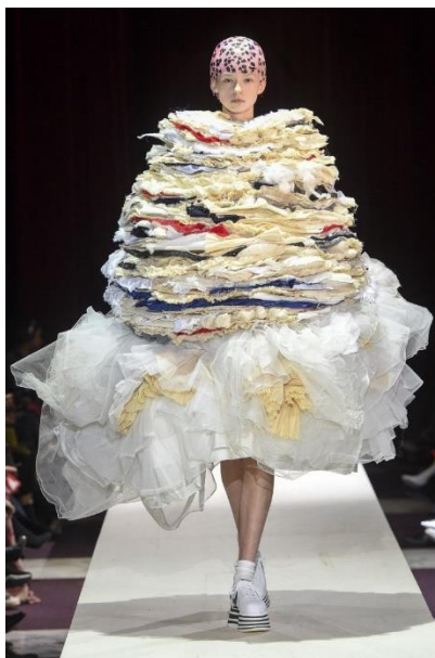
Рис.6. Рей Кавакубо для Comme des Garçons осень-зима 2018/2019 Ready-to-wear

Рей Кавакубо (в бренде Comme Des Garçons) и Йоджи Ямамото- пионеры деконструктивизма в моде, которые в 1980-90-х одах начали создавать одежду, бросающую вызов традиционным формам, часто с элементами намеренного разрушения и асимметрии [5,6] (Рис.6;7).