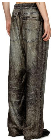
Рис.2. Джинсы Diesel с использованием цифровой печати для создания эффекта носки

Лазерная гравировка и эрозия ткани. Лазерные технологии позволяют не просто резать, но и контролируемо «состаривать» ткань, создавая эффекты выцветания, потёртости или ажурные узоры, будто бы проступившие сквозь время элементы. Это точный и экологичный способ создать видимость многолетней носки за секунды.