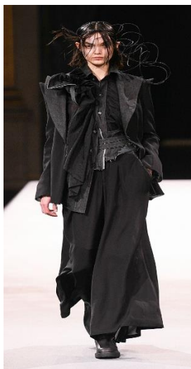
Рис.7. Йоджи Ямамото осень-зима 2022/2023 Ready-to-wear

Также ключевой фигурой следует считать Мартина Маржела, чья работа -это квинтэссенция метода палимпсеста. Он использовал апсайклинг, выцветшие ткани, наносил краску на готовые вещи, оставлял выкройки и пометки, обнажая процесс создания изделия [7].