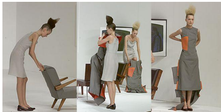
Рис.8. Хусейн Чалаян, осень 2000 год

Хелен Киркум - лондонский дизайнер обуви и художница, которая активно использует принцип палимпсеста в своих работах, создавая кроссовки из переработанных и выброшенных деталей другой обуви. Каждый элемент несет в себе историю предыдущих пар, что делает конечный продукт объектом, полным смыслов [9] (Рис.9.).