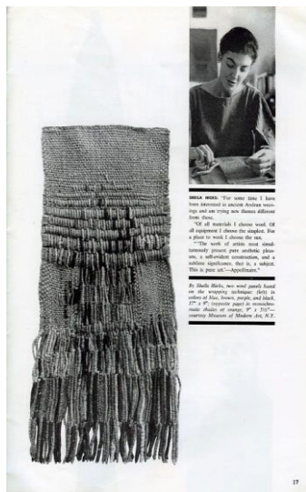
Рис.4. Работа Шейлы Хикс

Ручные техники. Ручное ткачество (в том числе на раме) позволяет создавать полотна с неоднородной структурой, варьируя плотность, толщину нити и переплетение (Рис.4.). Это дает возможность формировать объем непосредственно в процессе создания материала (Рис.5.). Например, утолщенные, рельефные участки могут создавать жесткий каркас, в то время как ажурные зоны обеспечивают пластику и динамику. Бренд, такой как Altuzarra в коллекции осень 2014, использует технику ткачества для создания сложных предметов одежды, которые сами по себе определяют крой и силуэт изделия, превращая костюм в «носимую архитектуру».