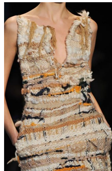
Рис.5. Коллекция Altuzarra, 2014

Вышивка. Выйдя за рамки плоского орнамента, стала инструментом рельефообразования. Объемная вышивка, использование нестандартных материалов (проволока, дерево, камни), техники «сашико» и другие создают на поверхности ткани сложный микрорельеф. Это не только обогащает визуальное восприятие, но и меняет физические свойства материала- он становится более жестким, структурированным что влияет на его драпируемость и поведение на фигуре. Дом моды Lesage, сотрудничающий с Chanel, является эталоном в превращении вышивки в текстильную скульптуру.