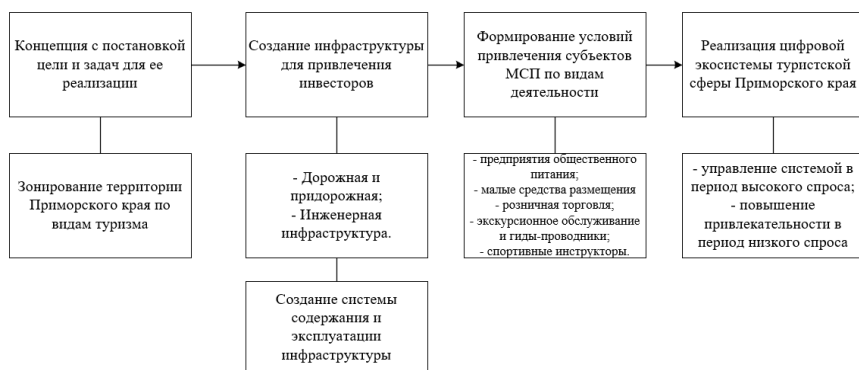
Рис. 4. Алгоритм формирования среды для создания условий адаптации МСП в туристском секторе Приморского края

Источник: составлено авторами по: Калабкина И.М., Завьялова Д.Д. Технология внедрения бенчмаркинга в деятельность туристского предприятия // Сервис в России и за рубежом. 2024. Т. 18. № 2. С. 239–246.