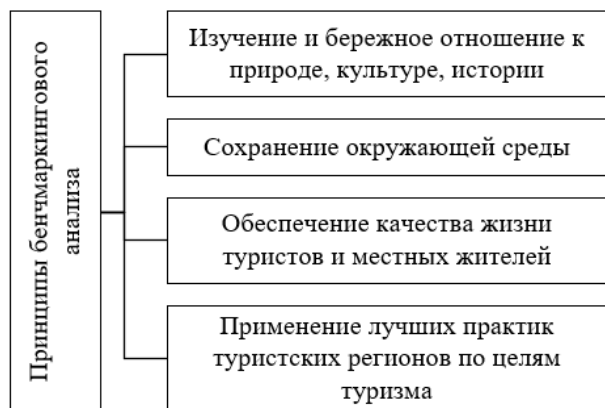
Рис. 3. Принципы бенчмаркингвого анализа для разработки стратегии адаптации субъектов МСП в сфере туризма Приморского края

На рисунке 4 представлен алгоритм разработки среды для развития деятельности МСП в туристском секторе Приморского края.