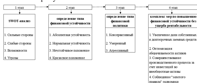
Рисунок 1 – Этапы стратегического обеспечения финансовой устойчивости предприятия инструментами финансового менеджмента

На первом этапе SWOT-анализу будут подвержены факторы, для оценки сильных и слабых сторон организации по отношению к возможностям и угрозам внешней среды и определения перспектив и возможностей их реализации. После выявления всех факторов необходимо оценить их по балльной шкале, в зависимости от значимости для вашего бизнеса.