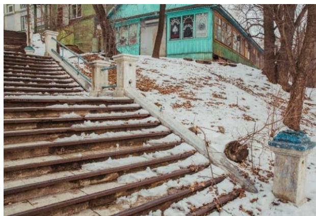
Рисунок 7. Сквер Матросского клуба