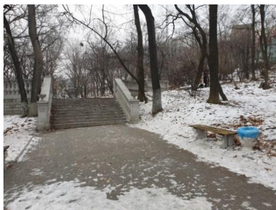
Рисунок 3. Покровский парк, центральная аллея

официально объявлен в июне 1990 года и был популярным местом отдыха горожан, но затем пришел в упадок. И сейчас место привлекает жителей ближайших жилых домов для прогулок и проведения пикников. В 2018 году по инициативе группы горожан было решено провести масштабную реконструкцию парка. В процессе разработки находится проект, в соответствии с которым предусмотрено строительство прогулочных дорожек, подготовка территории для возведения детского и спортивного городка, малых архитектурных форм, формирование элементов озеленения [5]. Основная проблема территории – крутой рельеф, который может явиться препятствием при создании объектов для использования МГН. Неожиданным достоинством парка является полное отсутствие архитектурных элементов наполнения территории, определяющих планировочную композицию. В связи с чем существует уникальная возможность организовать зону сенсорного сада «с нуля», выбрав наиболее подходящее пологое живописное место и уже затем – включить его в проект будущей реконструкции. Существует возможность организации входов в парк как с верхних, так и с нижних отметок рельефа. На верхних отметках в непосредственной близости к парку расположена остановка общественного транспорта, на нижних, к сожалению, остановки находятся вне зон пешеходной доступности. В проекте предусмотрен ряд парковок с выделением мест для МГН, что является необходимым условием для посещения парка и сенсорного сада.