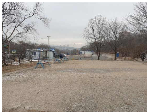
Рисунок 6. Парк Минного городка, центральная площадка