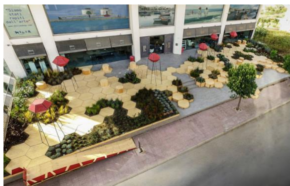
Рисунок 1. «Мульти-сенсорный» сад в природном стиле в Италии [3]

Модульный сенсорный сад-конструктор, который создает и продвигает компания «Сад в городе», можно легко передвигать с места на место, он позволяет украсить (озеленить) парк, сквер или любой другой ландшафт, или городскую среду в целом. Наряду с этим, конструкции сенсорного сада позволяют человеку ощутить себя рядом с природой, где можно походить босиком, наслаждаясь самыми разнообразными видами естественного покрытия: от благоухающей весенней травы до засыхающей древесной коры. Сенсорный сад можно установить на любую относительно ровную поверхность, с любым покрытием, любой формы и размера. Для его устройства не нужно проводить никаких земельных работ, что-то согласовывать, а также совсем не требуется рассаживать его в грунт, и он не испортит уже имеющийся газон (рис. 2) [6].