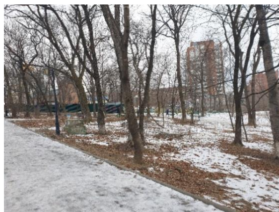
Рисунок 4. Покровский парк, северо-западная часть