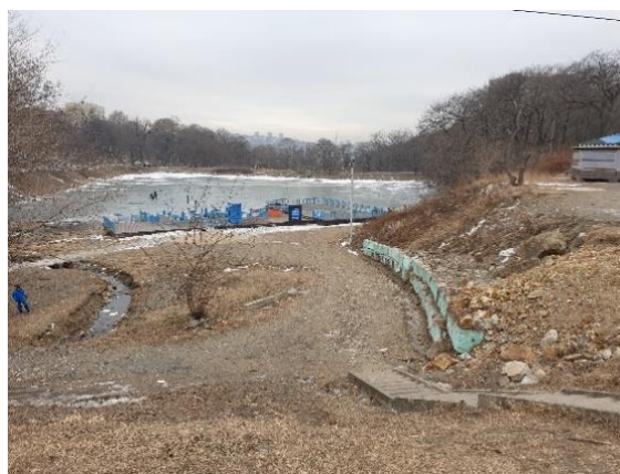
Рисунок 5. Парк Минного городка, территория у озер