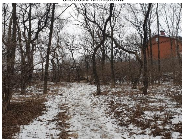
Рисунок 8. Нагорный парк, аллея

Сквер им. Суханова находится в центральной части города и является удобным транзитным пешеходным маршрутом. Участок сквера расположен на трех пологих террасах, с северо-восточной стороны к нему примыкает крутой склон с перепадом высот в 10 м. Ориентация территории – юго-западная, площадь – 2,5 га. Сквер находится на пересечении нескольких магистралей. Долгое время в сквере преобладала мемориальная функция – здесь расположен памятник герою гражданской войны Константину Суханову – проходили митинги, устраивались концерты. В настоящее время основной функцией сквера является рекреационная – это место отдыха взрослых и детей небольшого жилого района. К саммиту 2012 года сквер наряду с другими объектами гостевого маршрута Владивостока был реконструирован. Были уложены новые дорожные покрытия, установлена современная городская мебель, возведена детская площадка и высажены многочисленные насаждения: деревья, кустарники, цветы. Территория вдоль широкой прогулочной аллеи