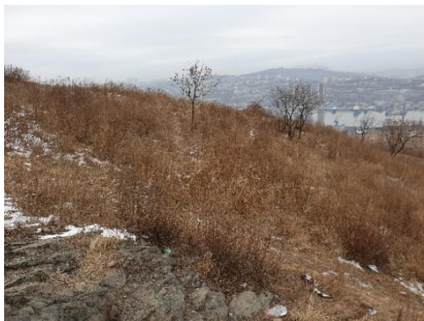
Рисунок 7. Нагорный парк, видовая площадка

4. Анализ территорий скверов Владивостока. С целью определения возможности размещения сенсорного сада был также рассмотрен ряд крупных скверов Владивостока. Если основной функцией парков является отдых граждан, то скверы являются многофункциональными пространствами, в зависимости от их назначения или места расположения в городской среде.