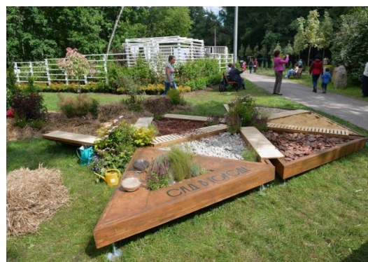
Рисунок 2. Модульный сенсорный сад-конструктор от компании «Сад в городе», Россия [6]

3. Анализ территорий парков Владивостока. Для анализа возможности организации сенсорного сада в г. Владивостоке были исследованы парки, являющиеся наиболее крупными озелененными городскими территориями. Из четырех городских парков были рассмотрены три, расположенные центральной части города и в непосредственной близости от него.