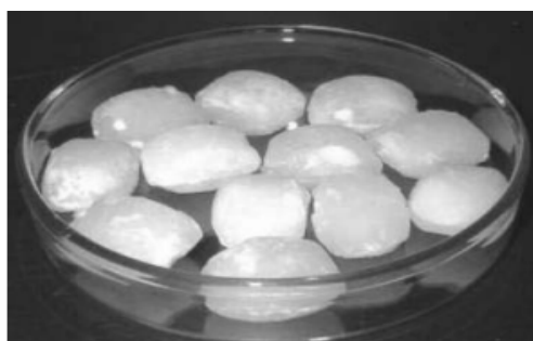
Рис. 6. Газогидратные гранулы

Кроме того, существует еще одна японская технология, при которой гидраты разделяются на гранулы приблизительно 20 мм в диаметре и транспортируются с помощью специально разработанных автомобилей контейнерного типа. Благодаря своей уникальной метастабильности при атмосферном давлении и температуре, гранулы остаются в твердом состоянии. Транспортировка таблетированного гидрата уже широко используется в Японии для поставки метана как крупным, так и мелким потребителям.