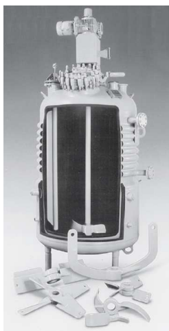
Рис. 4. Реактор CSTR

Немецкие ученые предложили непрерывную схему получения газового гидрата, основанную на принципе механического перемешивания с использованием формовочных прессов. Схема состоит из реактора непрерывного перемешивания (далее CSTR), устройств дегидратации, гранулирования, охлаждения. Авторы отметили, что внедрение газогидратных технологий в промышленность требует непрерывности процесса и малой энергозатратности, потому для больших объемов производств подходит именно реактор CSTR, но обязательно в сочетании с другими способами для ускорения процесса гидратообразования.