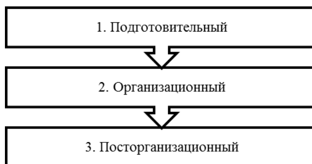
Рис. 1. Этапы организации мероприятий [3]

Организации событийного мероприятия включает 3 этапа (рис. 1) [3].