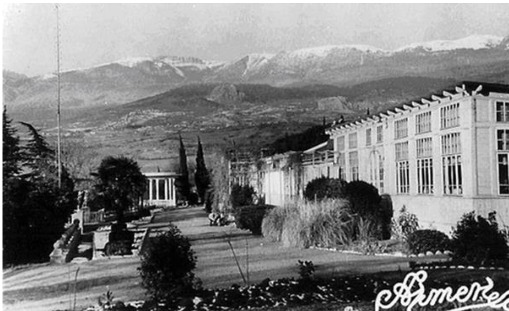
Рисунок 2. Здание круглогодичного «Верхнего» лагеря на 150 мест (лето 1927) [12]

Поэтому он сам лично выбрал место для организации такого лагеря в Крыму учитывая его микроклимат и защищенность от ветров и в 1925 году был открыт «Лагерь-санаторий в Артеке» (рисунок 2) для страдающих туберкулезом детей, ставший впоследствии самым знаменитым лечебно-оздоровительным лагерем Советского Союза - сегодня Федеральное государственное бюджетное образовательное учреждение «Международный детский центр «Артек». Открытие «Артека» проходило под эгидой Российского Общества Красного Креста, председателем ЦК, которого был Соловьев. Он также поставил перед РОКК задачу воспитания у населения «санитарной культуры», остро сформулировав ее как «право на чистоту» [12].