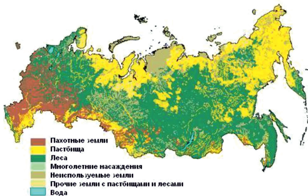
Рис. 1. Использование земель в России [8]