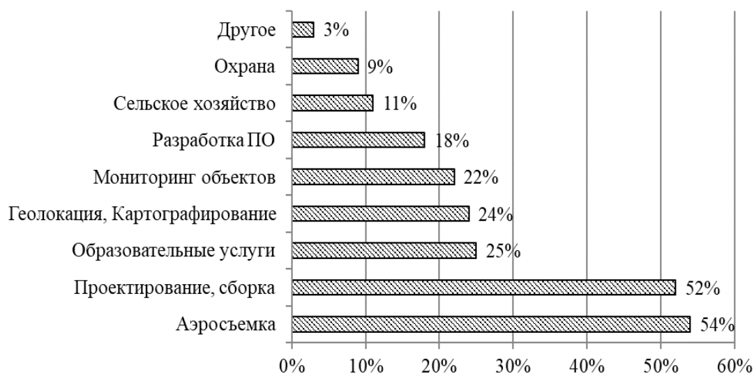
Рис. 1. Сферы деятельности российских компаний, работающих на рынке БПЛА