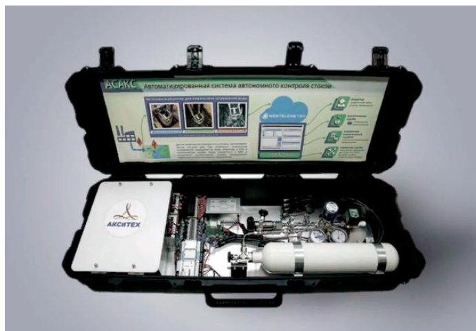
Рис. 3. Автоматизированная система автономного контроля стоков Fig. 3. Automated system of autonomous control of effluents