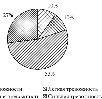
Рис. 4. Результаты исследования по критерию «Социальные страхи»

Анализ криминалистических страхов показал самую высокую тревожность по страхам (табл. 5, рис. 5): 57% респондентов имеют сильную степень тревожности; 16% респондентов – умеренную степень тревожности; 22% респондентов – легкую степень тревожности; 6% респондентов не имеют ее.