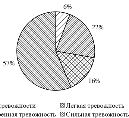
Рис. 5. Результаты исследования по критерию «Криминалистические страхи»