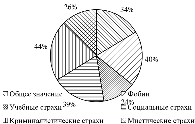
Рис. 1. Типы страхов, %

Среднее значение тревоги по всем видам страхов составило 34% (общий процент тревожности); 40% респондентов имеют среднее значение тревожности по фобиям; 24% респондентов – среднее значение тревожности по учебным страхам; 39% респондентов – среднее значение тревожности по социальным страхам; 44% респондентов – среднее значение тревожности по криминалистическим