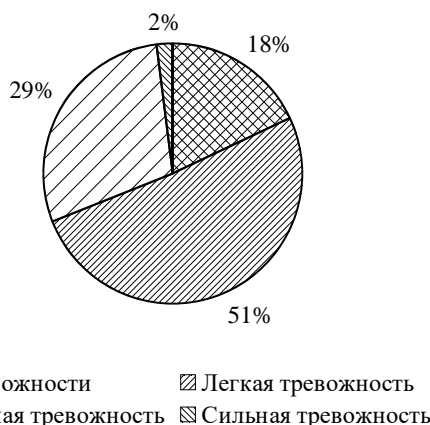
Рис. 3. Результаты наличия тревожности по критерию «Учебные страхи»

В результате анализа социальных страхов выявлено большое количество респондентов, имеющих показатели тревожности на уровне умеренной и высокой степени выраженности (табл. 4, рис 4): 53% респондентов имеют умеренную степень тревожности; 27% респондентов – сильную степень тревожности (в сумме 80%); 20% респондентов – легкую степень тревожности (10%) или не имеют ее (10%). Это свидетельствует об устойчивой боязни отвержения обществом, непризнания, насмешек, издевательств.