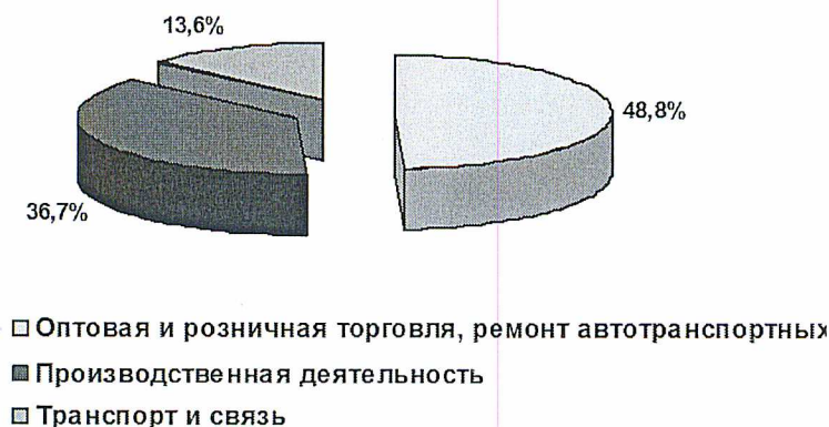
Рис. 1. Распределение опрошенных предпринимателей по отраслям экономики.

номики. Расчет выборки был произведен с возможностью смещения квот по отраслям экономики в пределах 5,5%. Распределение опрошенных предпринимателей по отраслям экономики и видам производственной деятельности представлено на рисунках 1 и 2.