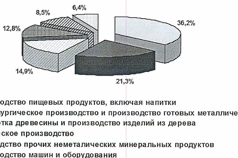
Рис. 2. Распределение опрошенных предпринимателей по видам производственной деятельности.

Распределение опрошенных предприятий по численности сотрудников предприятий представлено на рисунке 3.