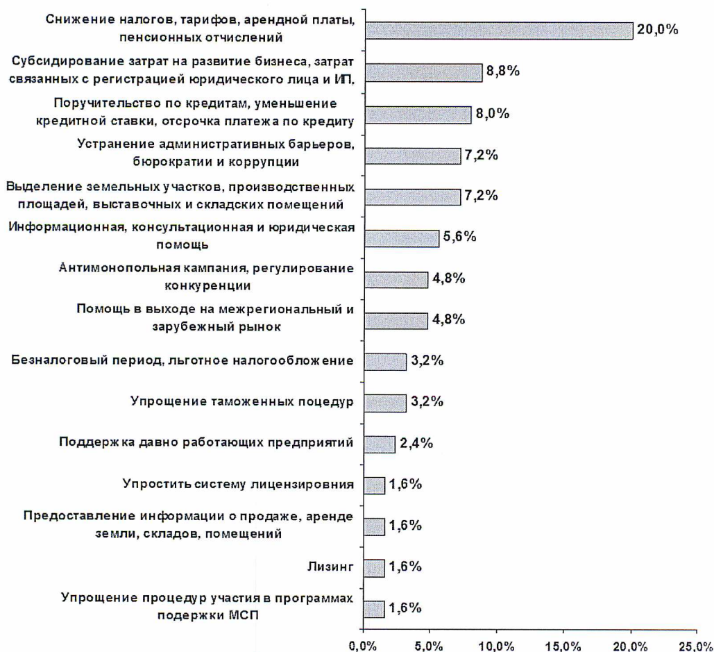
Рис. 6. Необходимые для развития бизнеса, с точки зрения предпринимателей, меры государственной поддержки.

ний рынок, предпринимателями считаются малоэффективными и маловостребованы. Открытые высказывания опрошенных предпринимателей позволили выстроить рейтинг потребностей в мерах и направлениях поддержки (рисунок 6).