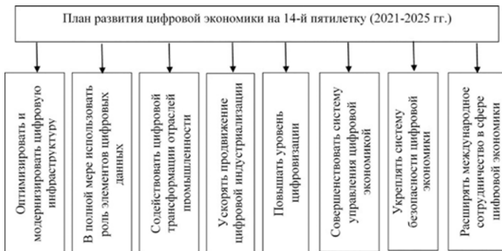
Рис. 2. Основные аспекты Плана развития цифровой экономики на 14-ю пятилетку

Цифровая экономика в Китае развивается согласно планам, которые разрабатываются как на национальном, так и на региональном уровнях. Так, каждая провинция имеет свои особенности и план развития цифровой экономики. Однако, безусловно, основным документом является план развития цифровой экономики на 14-ю пятилетку, опубликованный в январе 2022 г. В качестве главных целей выделены: увеличение доли добавленной стоимости ключевых отраслей цифровой экономики в структуре ВВП до 10% к 2025 г. с 7,8% в 2020 г.; увеличение числа домохозяйств, подключенных к широкополосной связи со скоростью не менее 1 Гбит/с, – до 60 млн к 2025 г. по сравнению с 6,4 млн в 2020 г. План включает 8 аспектов, отраженных на рис. 2.