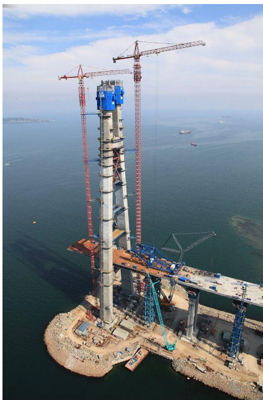
Рис. 1. Новый мост соединит город Владивосток с островом Русский

До сих пор главным препятствием на пути развития туризма в Приморском крае был низкий уровень развития инфраструктуры. Но в последние пять лет картина начала кардинально изменяться, так как в этот период начала реализовываться государственная программа подготовки Приморского края к саммиту АТЭС. Сейчас она вступила в свою завершающую стадию. Основной целью программы является превращение Владивостока в центр международного сотрудничества Азиатско-Тихоокеанского региона. Стоимость реализуемых проектов превышает 665 миллиардов рублей. Среди прочих проектов программы можно выделить следующие: строительство каскада мостов (рис. 1), крупнейших в Азии; строительство крупного гостиничного комплекса; реконструкция дорог, морского порта и аэропорта. Список культурных объектов пополнится новым оперным театром, современным океанариумом, ледовым дворцом [1].