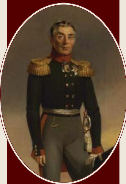
Портрет А.А. Аракчеева Художник Дж. Доу, 1823 г. Государственный Эрмитаж

Особой критике со стороны декабристов подвергся фактор сословного неравенства в ар-