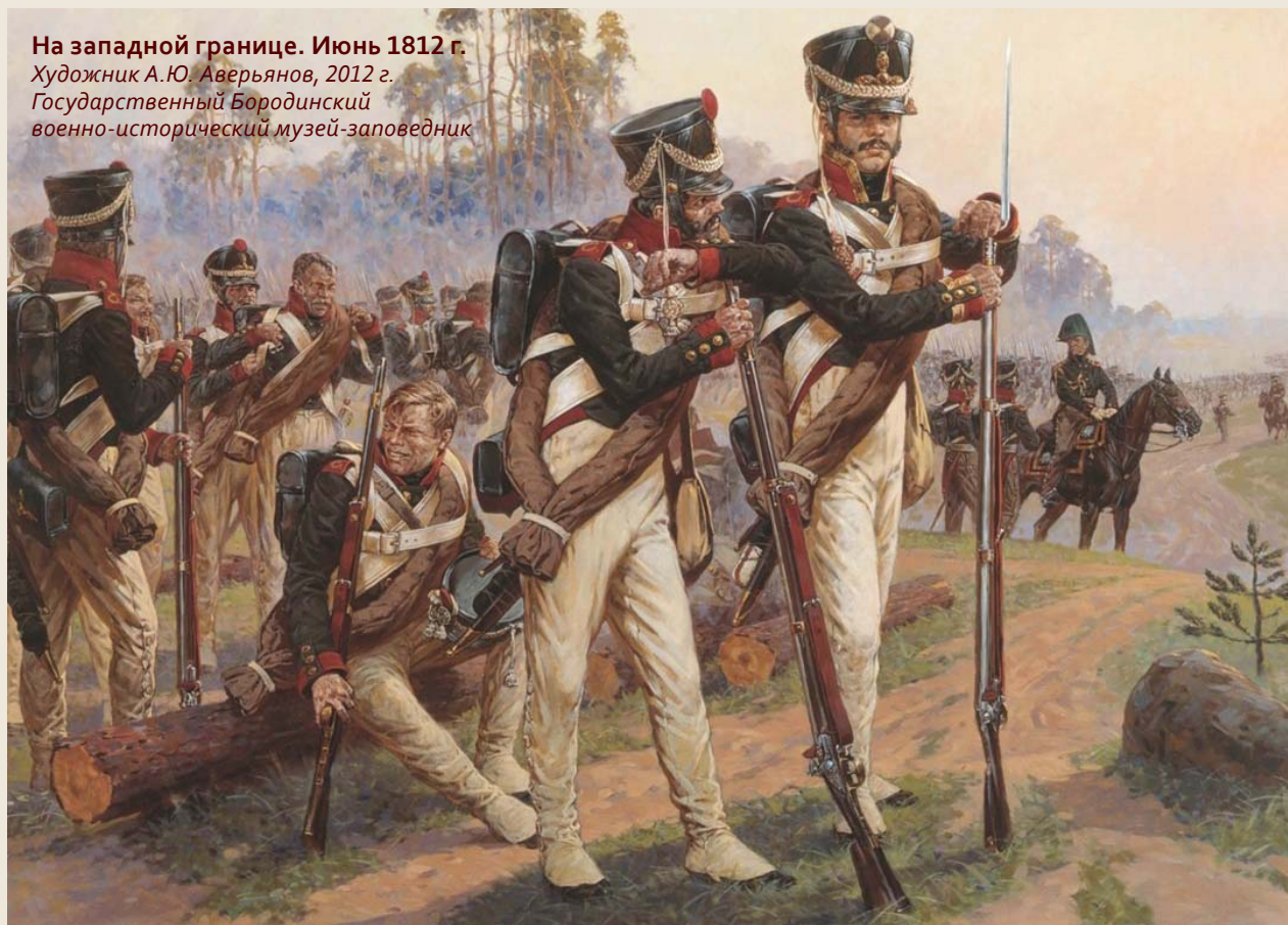
На западной границе. Июнь 1812 г. Художник А.Ю. Аверьянов, 2012 г. Государственный Бородинский военно-исторический музей-заповедник

вой щит», а как полноценные граждане, обладающие правами и свободами. Они выступали за пересмотр принципов военного управления и отказ от абсолютной власти императора над вооружёнными силами. Как писал С.И. Муравьев-Апостол, «армия — это часть народа, а не