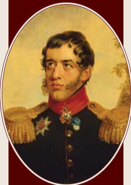
Портрет С.Г. Волконского Художник Дж. Доу, 1823 г. Государственный Эрмитаж

Для решения накопившегося комплекса армейских проблем декабристы предлагали пересмотреть принципы подготовки офицеров. Конституция Н.М. Муравьёва содержала мысль о создании системы военных училищ, в которых можно было бы получать профессиональное образование для будущей службы: «Военные училища должны воспитывать не слепое подчинение, а сознательное выполнение долга перед Отечеством» 36 . При