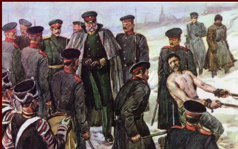
Сквозь строй (иллюстрация к рассказу «После бала»)

Художник П.А. Федотов, 1851—1852 гг., не завершена Государственная Третьяковская галерея