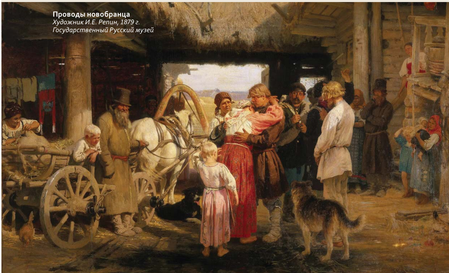
Проводы новобранца Художник И.Е. Репин, 1879 г. Государственный Русский музей

В ходе военной реформы второй половины XIX столетия многие идеи декабристов были реализованы на практике: создание системы обучения и подготовки резервистов; замена рекрутского принудительного набора на всесословную призывную службу (введена в 1874 г.), что позволило значительно увеличить численность армии и обеспечить её более качественную подготовку. Однако в отличие от декабристских программ реформа сохраняла определённые привилегии: отсрочки для представителей элиты, возможность «выкупа» службы и сословные различия в доступе к офицерским чинам. Особое внимание декабристы уделяли военному образованию, а реформа Д.А. Милютина, включавшая создание военных округов и систематическую подготовку офицеров, стала развитием этих инициатив. Идея Н.М. Муравьёва о «гражданском сознании» в армии нашла отражение в уставах 1860-х годов,