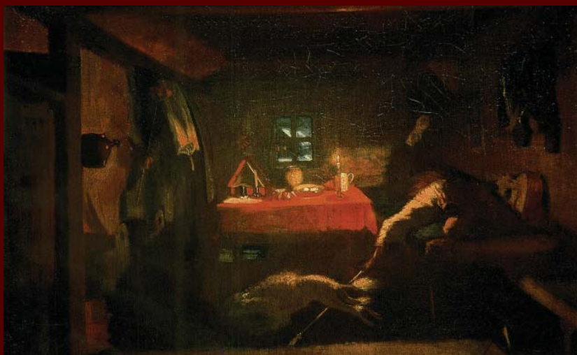
«Анкор! Еще анкор!»

Художник П.А. Федотов, 1851—1852 гг., не завершена Государственная Третьяковская галерея