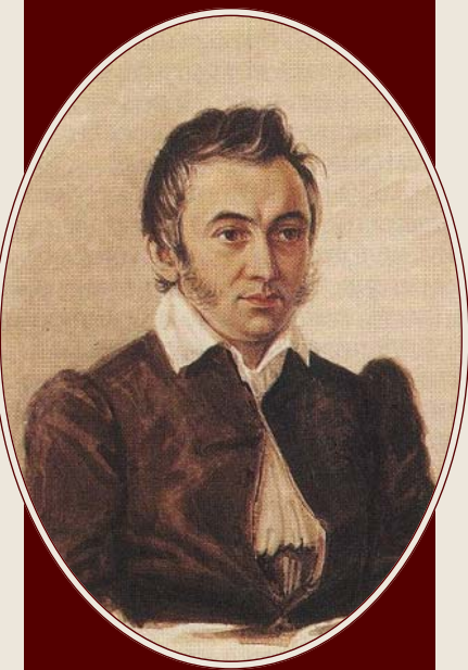
Портрет Н.М. Муравьева

М.С. Лунин выступил с идеей увеличения жалованья офицерам «в соразмерности с их нуждами», поскольку, бедно оплачиваемые, они были склонны к взяточничеству 30 . Как отмечал А.А. Бестужев-Марлинский, широкое распространение получило армейское казнокрадство: «В петербургском и кронштадтском адмиралтействе положено 190 лошадей для таскания бревен, но дело в том, что ни одна лошадь не работает, а возит по гостям чиновников, вместо них запрягают несчастных матросов» 31 . На фоне этого декабристы в своих письмах к им-