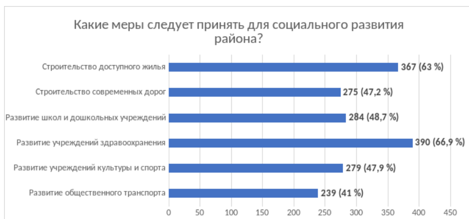
Рис. 3. Ответы респондентов на вопрос «Какие меры следует принять для социального развития района?»

На вопрос «Какие меры следует принять для экономического развития района?» были получены следующие ответы: основным направлением экономического развития жители района отметили создание территориально-производственных комплексов – 49,1%, развитие экспортно-ориентированных производств – 43,6%, развитие условий для туристических услуг – 40,1%, создать особую экономическую зону для развития инновационных видов деятельности – 30,4% опрошенных.