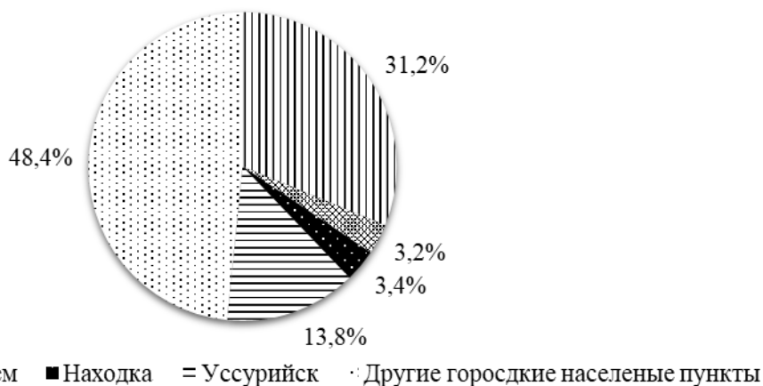
Рисунок 2 – Структура предприятий общественного питания Приморского края, в 2020 году в процентах

На начало 2019 года на территории Приморского края функционировало более 1 500 предприятий общественного питания и задействовано более 10 тысяч человек [13]. На основании мониторинга предприятий общественного питания, проведенного в 2019 году и обновленного в 2020 году, можно представить структуру данного сектора в Приморском крае следующим образом (рисунок 2).