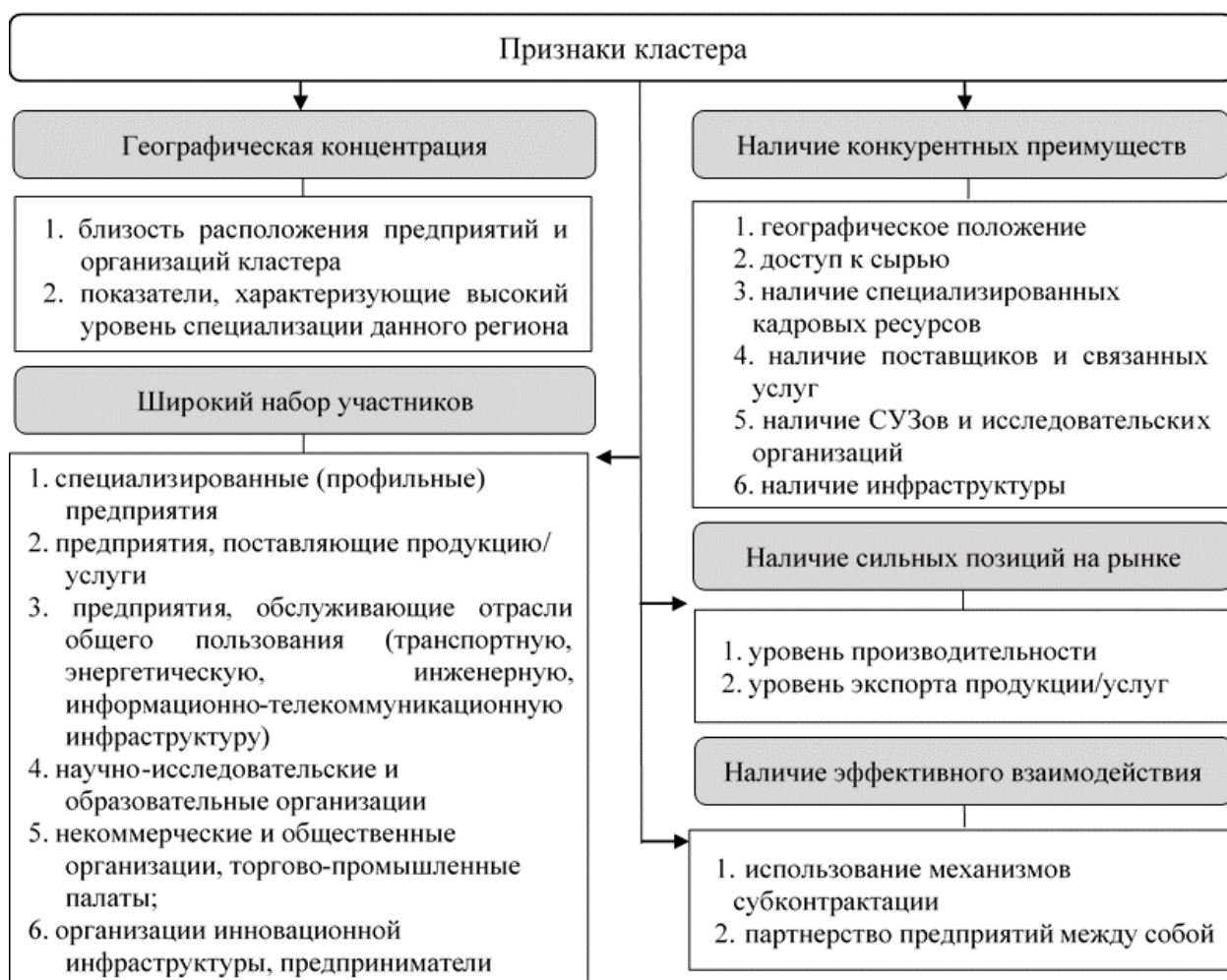
Рисунок 1 – Признаки кластера