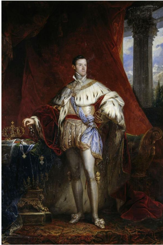
Карл Альберт 1798 – 1849) – король Сардинского королевства