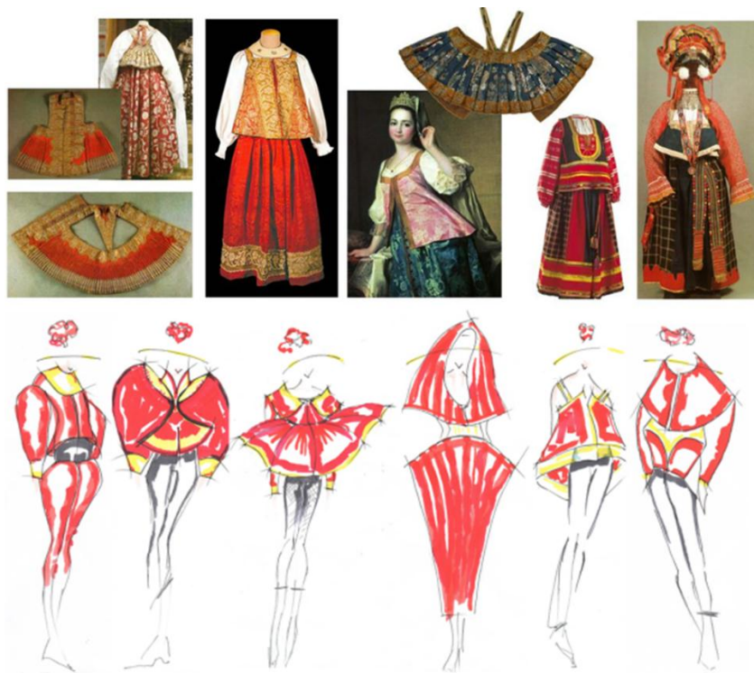
Рис. 2. Художественные эскизы коллекции моделей одежды под девизом «Платье-сувенир» и творческий источник

Коллекция построена по принципу контраста форм: объемный верх и низ малого объема. Базовая символ-форма эскизного ряда моделей определена формой душегреи, но путем не прямого копирования, а опосредованно через овальный силуэт, складчатые поверхности, современную посадку на фигуре, принты, актуальные детали и функционал костюма, при котором сохраняется идея уютной, «обволакивающей» одежды в формате жакетов, курток. Декоративный строй выстроен на использовании цветового решения и орнамента традиционного костюма, но с трансформацией современного прочтения. Введение красного цвета символизирует праздник, радость, что подчеркивает в коллекции ее сувенирный характер. Перечисленные композиционные средства в русле концепта коллекции «работают» на передачу эмоционального послания: тепло, уют и связь с корнями, что в современном мире становится ценностью самовыражения через одежду и создание уникального образа.