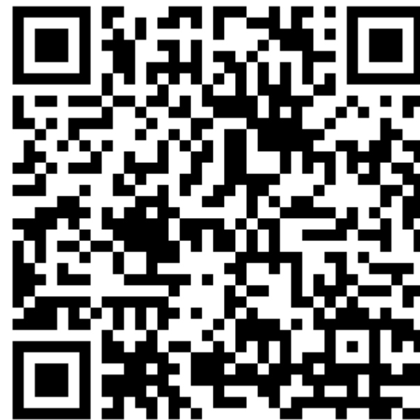
Образец заполнения заявления Р11001