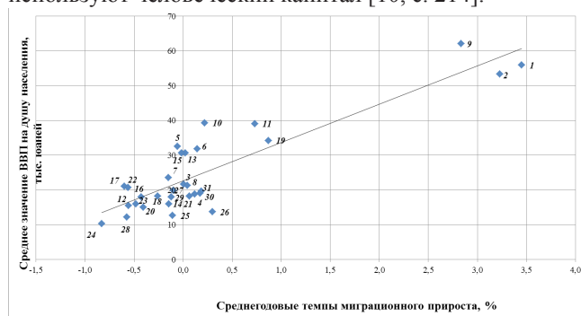
Рисунок 2 – Зависимость между средним подушевым значением ВВП и темпами миграционного прироста китайских провинций за 2000-2014 гг. [9]

показывали тесную положительную связь между ВВП на душу населения и уровнем урбанизации: активно урбанизирующиеся китайские регионы более эффективно используют человеческий капитал [10, с. 214].