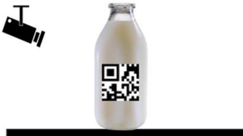
Рис. 1. Концепт работы SMART-полки

Может возникнуть вопрос, а как же полка будет рассчитывать вес, если на ней стоит не только один сок? Данная проблема решается путём использования машинного зрения [2] и определения им продуктов, находящихся на полке. После каждого открытия холодильника проводится перерасчёт и сохранение в базе банных веса каждого продукта. Другой проблемой, является скорость обработки машинного зрения и датчиков веса самой полки. Решение указанных проблем основано на увеличении скорости, до сотых миллисекунд, процесса измерения веса продуктов и анализа типа продуктов.