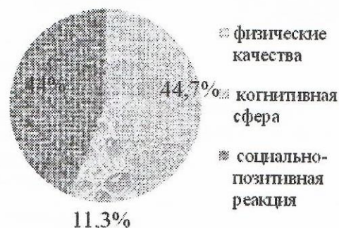
Рис. 2. Эмоциональное отношение учащихся и их родителей к совместным занятиям спортивной гимнастикой

Мы получили следующие варианты ответов. У детей с легкой степенью умственной отсталости наблюдается бедность ответов, представленная тремя категориями анализа, аналогичная картина и у родителей данных детей. Относительный уровень представленной категории социально позитивной реакции — 44 % (примеры ответов: отличник, воспитанный, хороший, непобедимый). Следующая категория — физические качества — 44,7 % (ответы: сильный, выносливый, здоровый, крепкий). Таким образом, мы видим, что дети с легкой степенью умственной отсталости в целом позитивно воспринимают нормальных детей как физически более развитых и принятых обществом. При этом когнитивная (познавательная) сфера представлена менее значимой (11,3 %), чем физическая и социальная.