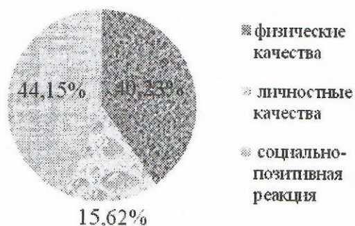
Родители детей с легкой степенью умственной отсталости