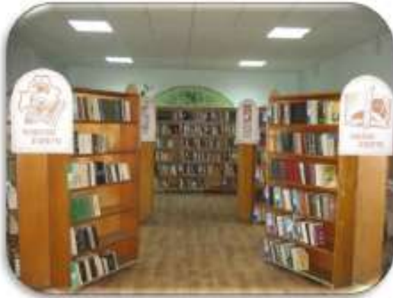
книга – библиотека