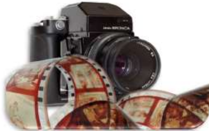
фотография – альбом