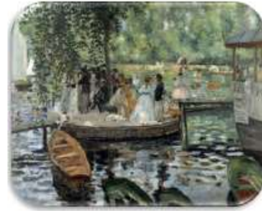
картина – музей

Хранение и накопление являются одними из основных действий, осуществляемых над информацией и главным средством обеспечения ее доступности в течение некоторого промежутка времени.