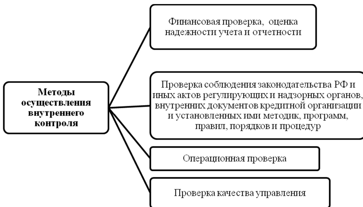
Рис.3. Методы проверок службой внутреннего контроля

Методы внутреннего контроля можно разделить на: