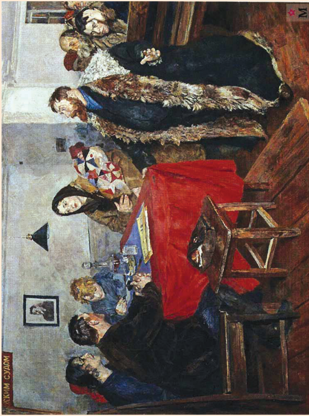
Б. В. Йогансон. «Советский суд» (1928)