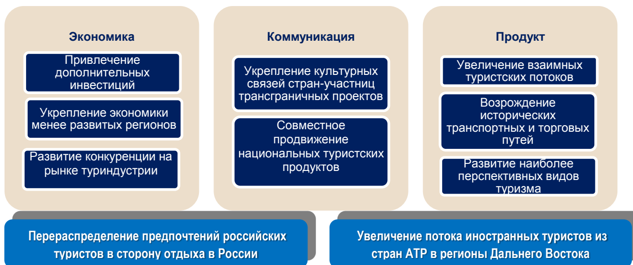
Рисунок 1 – Модель развития межрегионального и трансграничного сотрудничества в рамках проекта «Восточное кольцо России»

В основе проекта лежит модель межрегионального и трансграничного сотрудничества в сфере туризма, через региональную экономику, развитие туристского продукта, эффективную коммуникацию. В итоге внешние условия и внутренние усилия участников проекта привели к перераспределению предпочтений российских туристов в сторону отдыха на российских курортах и увеличения потока иностранных туристов преимущественно из стран АТР (рисунок 1).