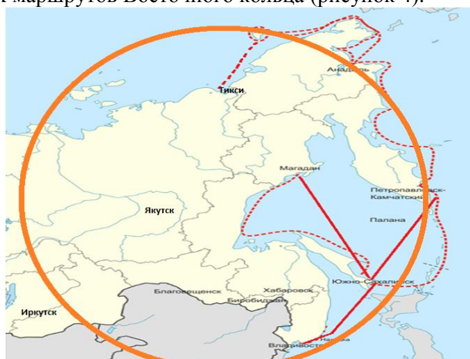
Рисунок 4 – Морские маршруты Восточного кольца России

Как отмечается Минэкономразвития «Развитие арктического и северного туризма крайне недооценено. Сегодня перед нами стоит непростая задача – изменить стереотипы россиян о хорошем, качественном и, главное, недорогом отдыхе. Зачем отправляться в Канаду, если есть возможность незабываемо отдохнуть в Якутии?». С этим конечно, можно поспорить. Например, месячный круиз на ледоколе «Хлебников» летом 2016 года стоил от 15 до 30 тыс.долларов на одного человека. Тем не менее, проложенные маршруты, инвестиции в портовую и социальную инфраструктуру Дальневосточного севера, строительство судов, безусловно, будут способствовать развитию круизного туризма в рамках Восточного кольца России. В настоящее время есть принципиальная логистика морских маршрутов Восточного кольца (рисунок 4).