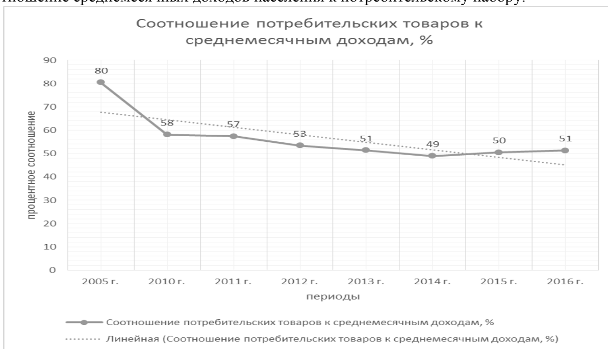
Рис. 2. Соотношение потребительских товаров к среднемесячным доходам

Также мы сравнили средний размер заработной платы с величиной средней стоимости фиксированного набора потребительских товаров и услуг за период 2005, 2010–2016 гг. Благодаря этому сравнению мы сделали несколько выводов: что среднемесячный денежный доход на душу населения больше стоимости фиксированного набора потребительских товаров и услуг. На рисунке 2 представлен график, где можно увидеть процентное соотношение среднемесячных доходов населения к потребительскому набору.