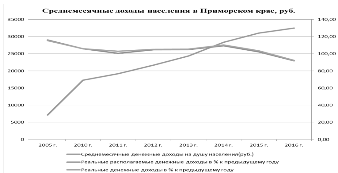
Рис. 1. Система показателей оценки уровня доходов населения Приморского края в 2005, 2010-2016 гг.

На рисунке 1 можно наблюдать сравнение реальных располагаемых денежных доходов и реальных денежных доходов. На период с 2010-2016 г. реальные денежные доходы на небольшой процент превышают реальные располагаемые доходы. Кроме 2005 г. где, реальные денежные доходы по сравнению с реальными располагаемыми доходами уменьшились на 70%, а в 2010г. эти показатели были равны. При этом среднемесячные денежные доходы в период с 2010-2016 гг. в среднем доходы населения увеличивались на 2524,8 руб.