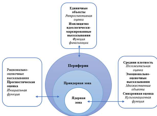
Рис. 3. Концепт оценочных высказываний британского дискурса спортивного комментария