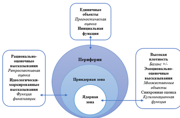
Рис. 2. Концепт оценочных высказываний российского дискурса спортивного комментария