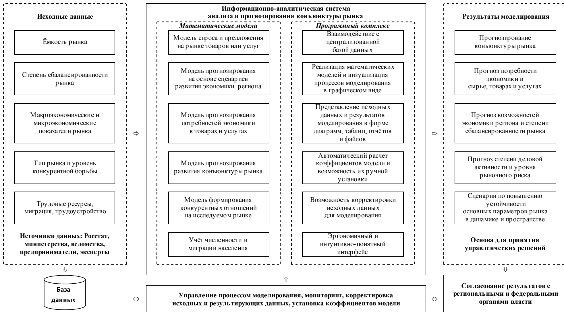
Рис. 2. Концептуальная схема информационно-аналитической системы анализа и прогнозирования конъюнктуры рынка ССМКР