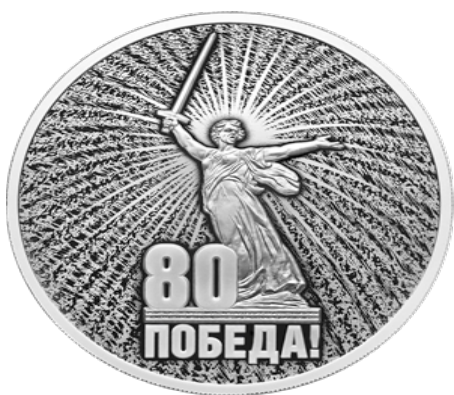
Рисунок 2. 3-рублевая серебряная монета с эмблемой 80-летия Победы в Великой Отечественной войне 1941-1945 годов на фоне искрящегося салюта.

Это уникальный пример коммуникации с массами посредством де-