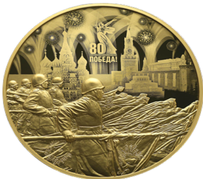
Рисунок 5. 10000-тысячная рублевая золотая монета с группой советских воинов, бросающих вражеские знамена, на фоне праздничного салюта на Красной площади и эмблема 80-летия Победы в Великой Отечественной войне 1941-1945 годов.