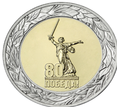
Рисунок 6. 50-тирублевая монета из недрагоценного металла, с одной стороны изображены ветви лавра и дуба, с другой - эмблема 80-летия Победы в Великой Отечественной войне 1941-1945 годов и лавровый венок вдоль канта.

Рисунок 5. 10000-тысячная рублевая золотая монета с группой советских воинов, бросающих вражеские знамена, на фоне праздничного салюта на Красной площади и эмблема 80-летия Победы в Великой Отечественной войне 1941-1945 годов.