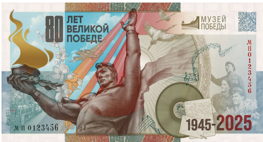
Рисунок 1. Сувенирная банкнота.

На банкноте изображены образы: на фоне цветущей яблони и мирного, ясного неба силуэт Солдата-Победителя в руке держащего каску, увитую лавром, в которой горит пламя вечной памяти и славы, огонь в руке солдата «пульсирует»; женщины-летчицы Раскова Марина, Ломако Вера, Осипенко Полина; на фоне грозовых туч статуя женщины, которая может быть дочкой, женой или матерью, скорбяще склоненная над телом павшего солдата; здание Музея Победы на Поклонной горе; исторические артефакты: фрагмент подлинного письма с фронта, страницы Книги Па-