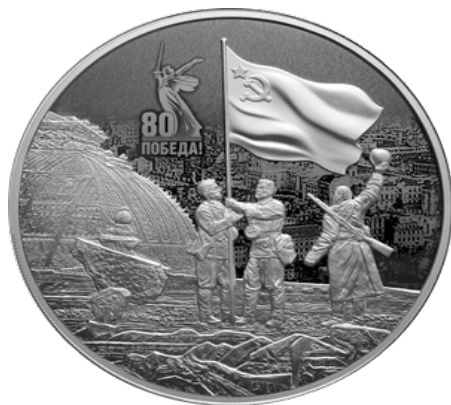
Рисунок 3. Сторублевая серебряная монета с советскими воинами, водружающими флаг над Рейхстагом, на фоне панорамы разрушенного Берлина и эмблема 80-летия Победы в Великой Отечественной войне 1941-1945 годов.