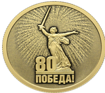
Рисунок 4. 50-ти рублевая золотая монета с эмблемой 80-летия Победы в Великой Отечественной войне 1941-1945 годов на фоне искрящегося салюта.