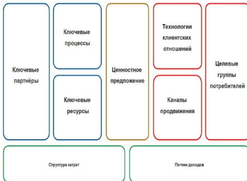
Рис. 1. Шаблон (канва) бизнес-модели А. Остервальдера – И. Пинье

На рис. 1 представлен шаблон классической бизнес-модели Александра Остервальдера (Alexander Osterwalder) – Ива Пинье (Yves Pigneur), которая на сегодняшний день – наиболее универсальная. Ее преимуществом является оригинальное графическое решение (архитектура), а именно матричный шаблон, который авторы назвали канвой бизнес-модели (Business Model Canvas) 1 .