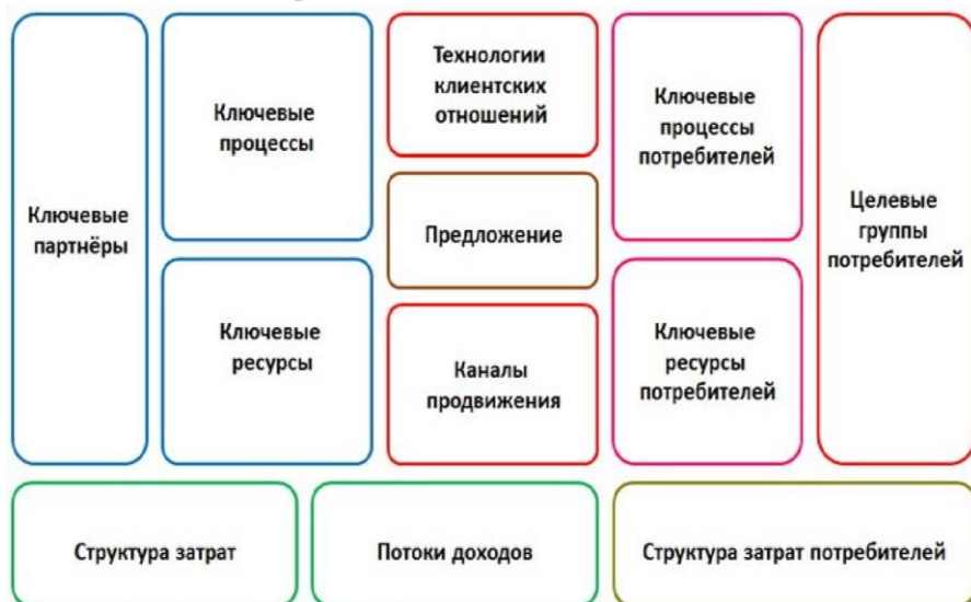
Рис. 6. Канва бизнес-модели совместного создания стоимости / ценности Э. Филта

Далее Э. Филт разработал канву бизнес-модели совместного создания стоимости / ценности (рис. 6).