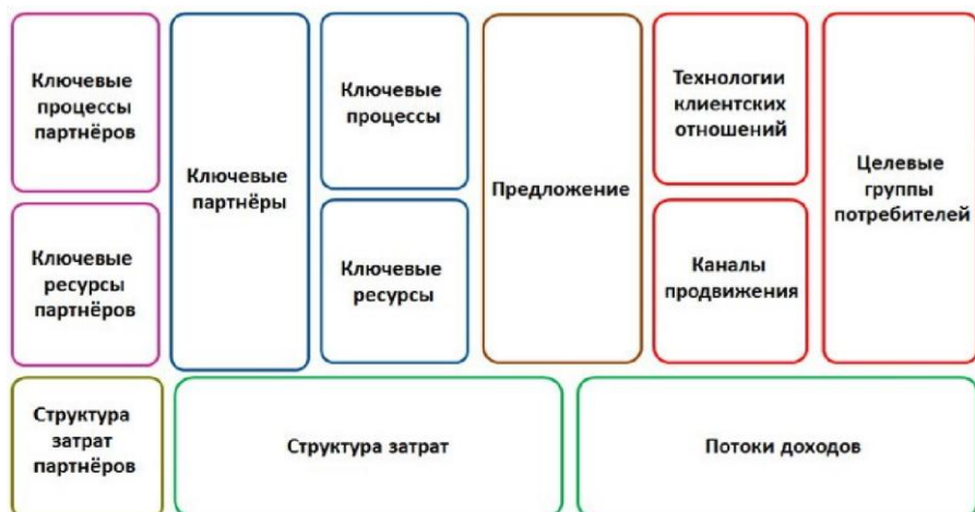
Рис. 7. Канва бизнес-модели партнерства Э. Филта

Отличительной особенностью данной бизнес-модели является то, что Э. Филт вводит новые компоненты в архитектуру классической канвы А. Остервальдера и И. Пинье и переформатирует старые элементы.