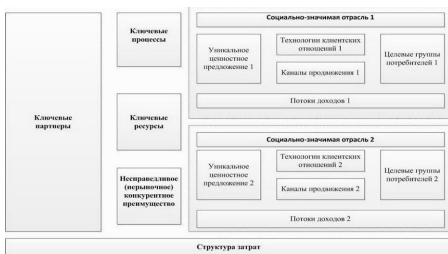
Рис. 10. Инновационная бизнес-модель государственного франчайзинга

При разработке модифицированного шаблона бизнес-модели государственного франчайзинга была изменена архитектура и содержательное наполнение классической бизнес-модели А. Остервальдера – И. Пинье посредством ее комбинирования с бизнес-моделью Э. Маурьи. В частности, остались общие блоки «Ключевые партнеры», «Ключевые процессы», «Ключевые ресурсы», «Структура затрат», добавлен элемент «Несправедливое (нерыночное) конкурентное преимущество» из бизнес-модели Э. Маурьи. Данный элемент также является общим. В модифицированной бизнес-модели выделены элементы «Социально значимая отрасль 1», «Социально значимая отрасль 2», для которых прописаны свои элементы «Уникальное ценностное предложение 1,2», «Технологии клиентских отношений 1,2», «Каналы продвижения 1,2», «Целевые группы потребителей 1,2», «Потоки доходов 1,2».