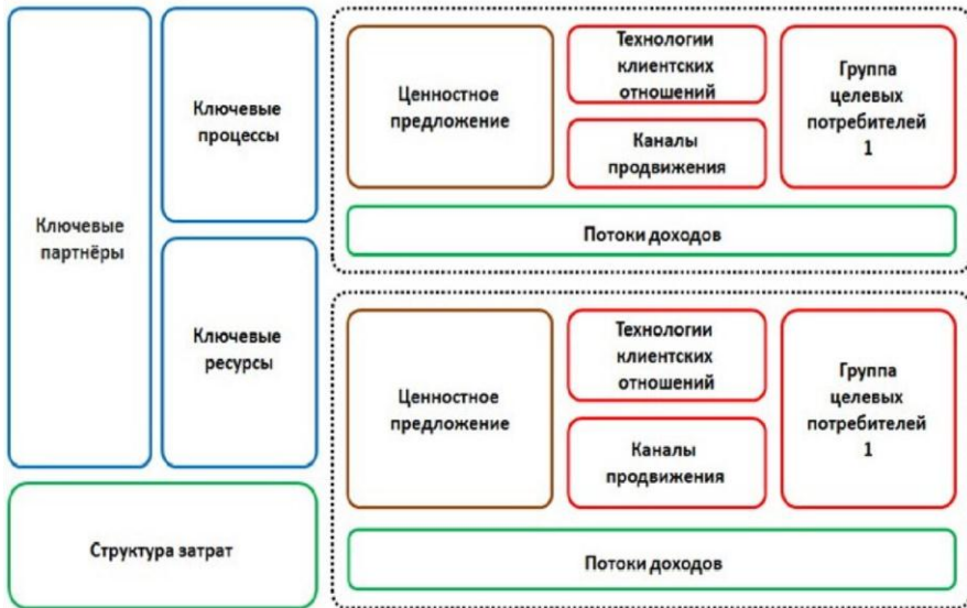
Рис. 4. Канва бизнес-модели диверсифицированных рынков Э. Филта (1)

предложение для двух разных групп потребителей, или, наоборот, для одной целевой группы потребителей два ценностных предложения.