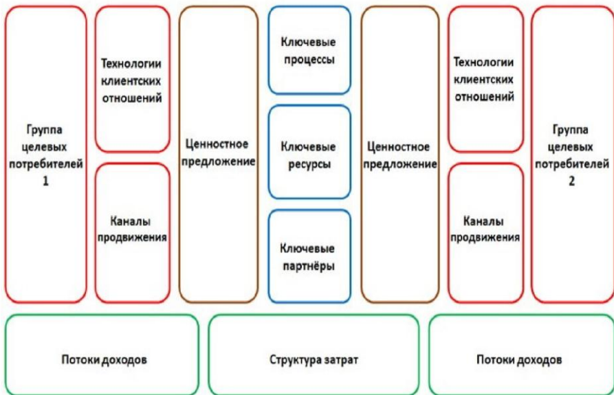
Рис. 5. Канва бизнес-модели диверсифицированных рынков Э. Филта (2)