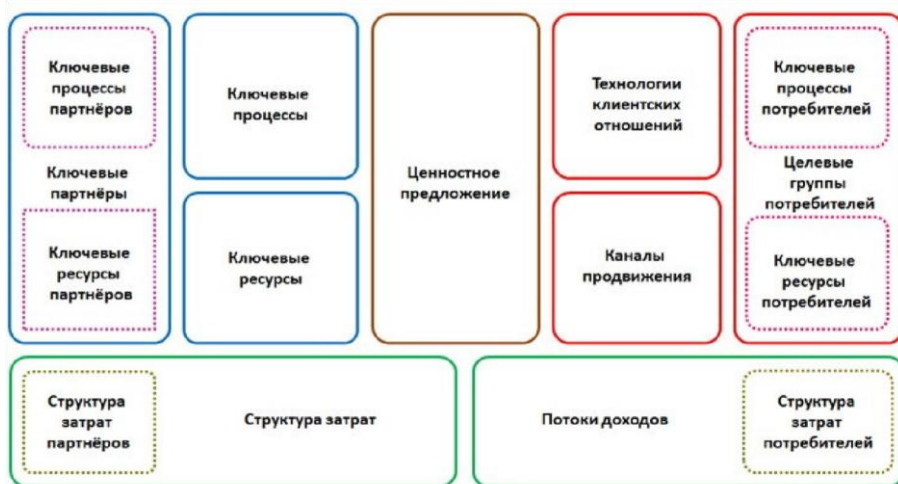
Рис. 8. Канва бизнес-модели совместного создания ценности и партнерства Э. Филта

На основе двух предыдущих моделей Э. Филт разрабатывает канву бизнес-модели совместного создания ценности и партнерства (рис. 8). Отличительной особенностью данной бизнес-модели от классической модели А. Остервальдера–И. Пинье является то, что ее отдельные компоненты дополнены элементами, иллюстрирующими деятельность, возможности и затраты потребителей и партнеров компании.