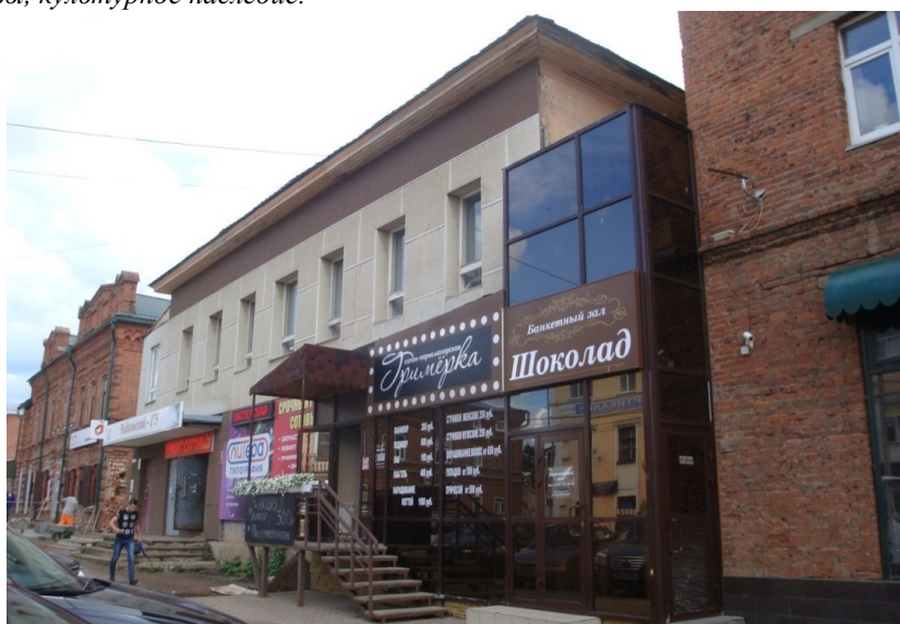
Рис. 1. Бывший дом Адамовых, ул. Ленина, 2. Фото автора, 2018

Ключевые слова: История Удмуртии, история домов Воткинска, купечество Вятской губернии, благотворители Адамовы, культурное наследие.