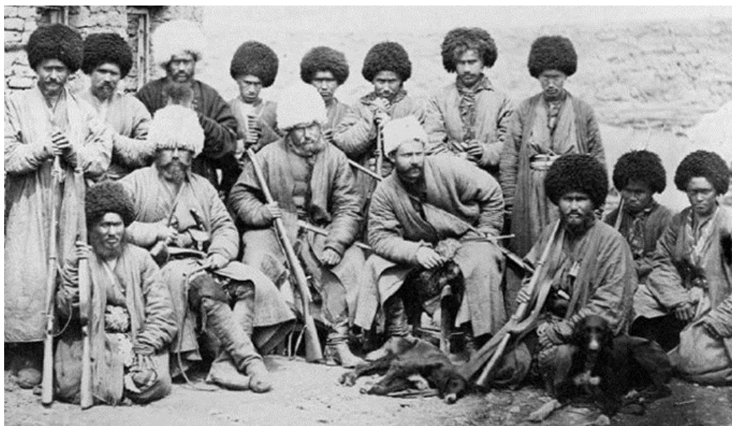
Рис. 1. М. Алиханов-Аварский сидит в центре на белой папахе (туркменский тельпек) и держит винтовку на правой руке

Обратиться вторично к исторической личности этого незаурядного человека нас понудили именно две фотографии, обнаруженные еще в середине восьмидесятых годов XIX века через страницы тогдашнего издания «Всемирная иллюстрация» и выложенные недавно Владимиром Фетисовым в интернет для всеобщего обозрения [4]. Ниже воспроизводим эти фотографии (Рис. 1, 2), отражавшие два момента из закаспийского (туркменского) периода жизни М. Алиханова-Аварского. Начнем с выявления личностей фигурантов, отраженных на первой из них, а именно с коллективной фотографии (Рис. 1).