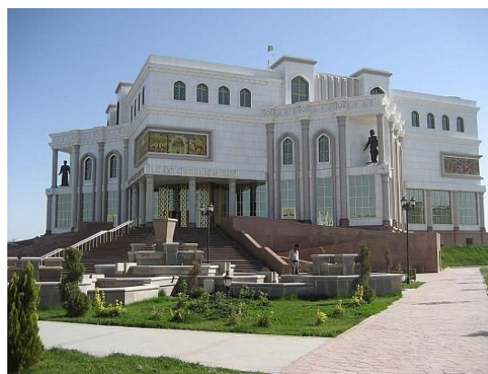
Рис. 5, 6. Образцы современной архитектуры города Мары