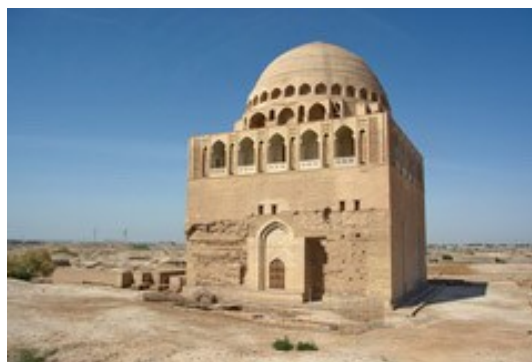
Рис. 3, 4. Остатки из архитектуры древнего Мерва (Мары)