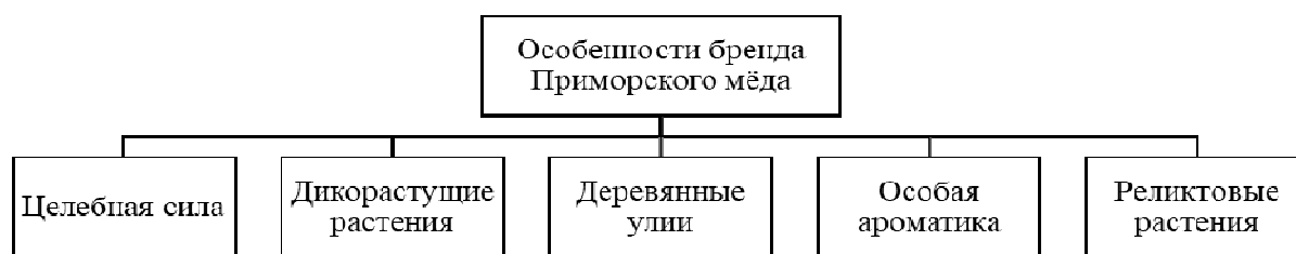
Рис. 2. Особенности бренда «Приморского мёда»

Особенности производства Приморского мёда (использование эндемичных и реликтовых растений), позволяет выделить его в настоящий бренд. Здесь стоит отметить, что ценность и исключительность бренда заключаются в целебной силе дикорастущих и реликтовых растений, используемых при производстве мёда, а также в особой ароматике получаемых продуктов.