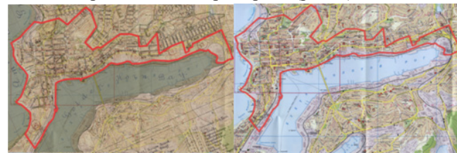
Рисунок 1 – Наложение карты 1918 года на современную карту города

На карте города от 1918 года опубликованной «Young Men's Christian Association» (Юношеская христианская ассоциация) [21] заметно явное разделение города на исторический центр или старый город, и прилегающие районы. Исторический центр обозначен буквой А. Методом наложения карты 1918 года на современную карту города Владивостока можно получить точные границы исторического центра города (рис. 1).