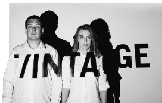
Рис. 2. Дизайн игра 2.0 – развитие, инструменты и рост дизайнера