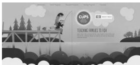
Рис. 5. Применение 3D моделей в web-дизайне