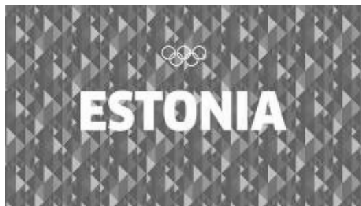
Рис. 3. Концепт формы эстонской сборной для Олимпийских игр