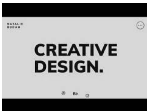
Рис. 1. Авторский онлайн-курс Ольги Шевченко