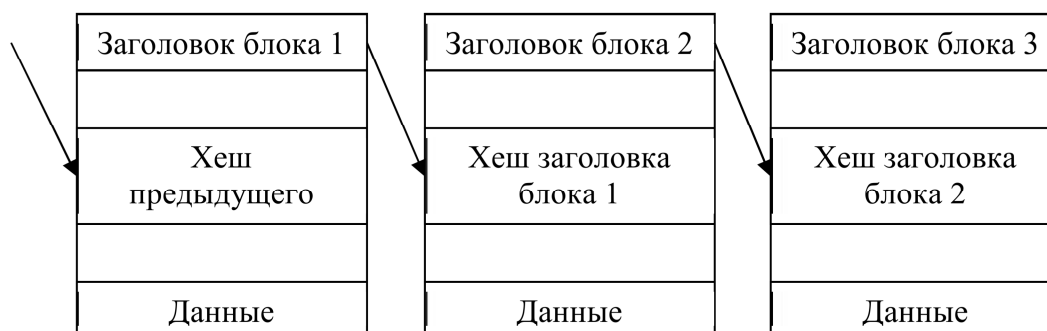
Рисунок 2 - Схема сцепления блоков транзакций

также различных процедурах верификации, является технология сцепления блоков транзакций (blockchain) (рисунок 1) [1].