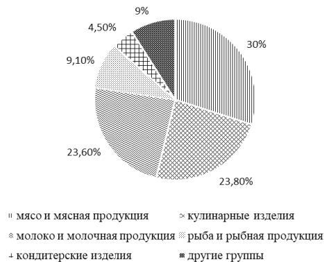
Рисунок 2 – Структура выявленных нарушений по группам пищевых продуктов по результатам проверок Федеральной службы по надзору в сфере защиты прав потребителей и благополучия человека за 2019г., %

По результатам проверок Роспотребнадзора за 2018–2019 года на предприятиях продовольственной торговли Приморского края большая часть зафиксированных нарушений связана с несоблюдением ТР ТС 021/2011 «О безопасности пищевой продукции», ТР ТС 034/2013 «О безопасности мяса и мясной продукции», ТР ТС 034/2013 «О безопасности молока и молочной продукции». В структуре пищевой продукции не соответствующей обязательным требованиям технических регламентов пищевого назначения, выявленной Роспотребнадзором Приморского края, наибольший удельный вес, а именно 77,4%, приходится на следующие группы пищевых продуктов: мясо и мясная продукция, кулинарные изделия, молоко и молочная продукция (рисунок 2) [14, 15].