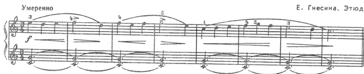
Рис. 1. Е. Гнесина. Этюд

Новый этап в развитии координации наступает при переходе к исполнению пьес двумя руками одновременно: трудности возникают при соединении рук. Именно на этой ступени зачастую искажаются звучание и ритм пьесы, разрушается её цельность, допускаются технические ошибки; нарушается и пластичность движений, которые становятся «корявыми». Чтобы избежать этих недостатков, нужно игру двумя руками одновременно начинать с пьес, в которых аккомпанемент был бы предельно лёгким и удобно расположенным (рисунок 1).