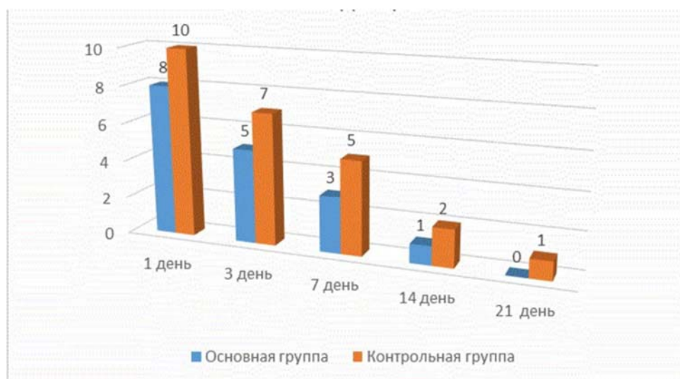
Рис.1 Алгограмма боли (показатель VAS, баллы) у пациентов на этапах лечения с использованием стандартной повязки и без