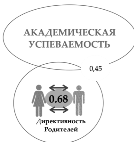
Рисунок 2 Взаимосвязи академической успеваемости с родительскими отношениями в группе Б

(Figure 1 The relationship of academic performance with parental relationships in group) A