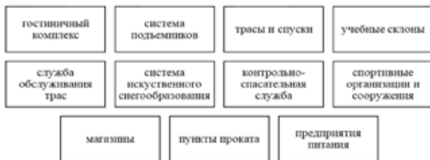
Рис. 1. Элементы организации горнолыжного курорта

Современный горнолыжный центр включает целый ряд объектов, технических средств и организаций (рис. 1) [5].