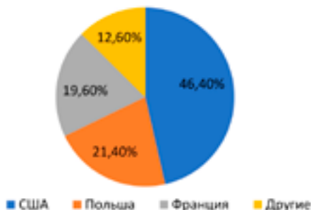
Рис. 3. Лидеры иностранного туристского потока в Камчатский край

Исследование показало, что иностранных туристов привлекают культурно-исторические достопримечательности — 34 %; возможность заняться активными видами отдыха (горными лыжами, сафари на джипах, парусным спортом, дайвингом, пешим туризмом и пр.) — 22 %. Все больше туристов привлекает уникальная природа: моря, реки, вулканы, пляжи и заповедники — 20 %.